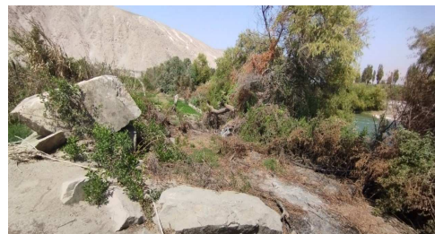
vista hacia aguas abajo, parte final de tramo identificado