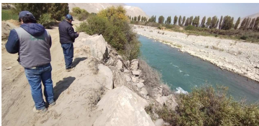
vista hacia aguas abajo, dique con enrocado deteriorado